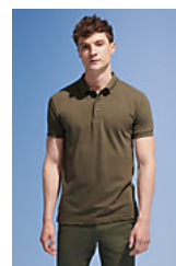
SOL'S PRIME MEN 00571