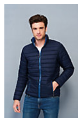
SOL'S RIDE MEN 01193