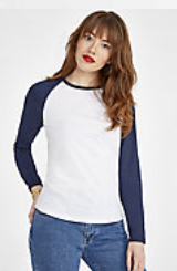
SOL'S MILKY LSL 02943