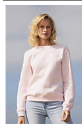
SOL'S SULLY WOMEN 03104