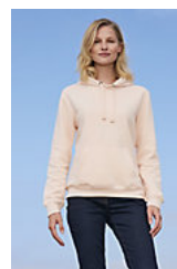
SOL'S SPENCER WOMEN 03103